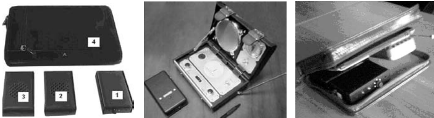
Рис.1. Стандартный АДВОКАТ-3 АВТО включает радиоуправляемые акустические колонки 2,3 и модуль управления 1, переносимые в элитном кейсе (папке); PSP-1А (в центре) располагается прямо на рабочем столе руководителя; PSP-2А АУТО обеспечит конфиденциальность переговоров один на один

Принцип такой же, причем акустика PSP-1А располагается там, где и пред-