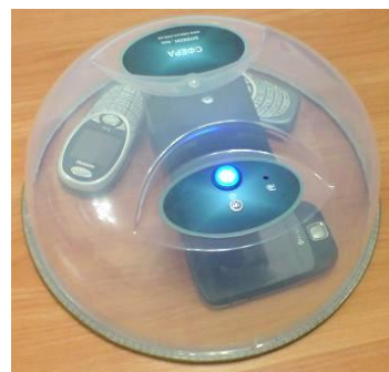
Рис.1 Изделие «СФЕРА»